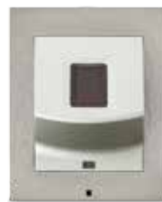
2N® ACCESS UNIT FINGERABDRUCKLESER