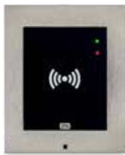
2N® ACCESS UNIT RFID

ord. 916009 (125kHz) ord. 916010 (13.56MHz)