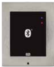
2N® ACCESS UNIT BLUETOOTH

ord. 916009 (125kHz) ord. 916010 (13.56MHz)