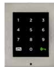
2N® ACCESS UNIT TASTATUR