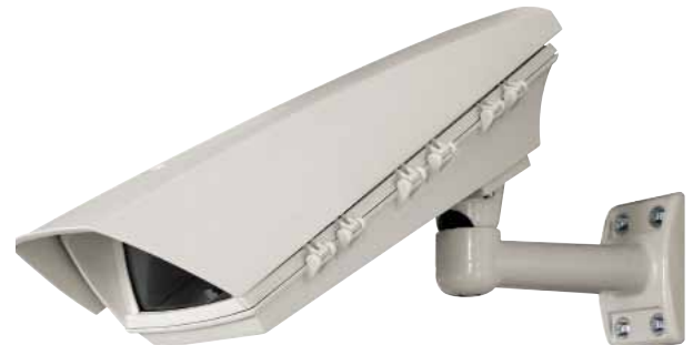
PUNTO + WB0VA2