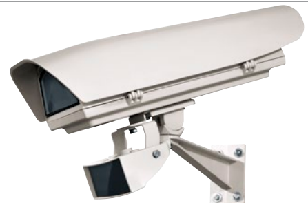
HOV + OSUPPIR + GEKO IRH + WBJA